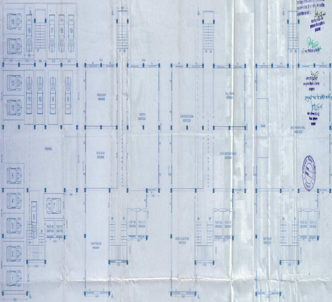
STILT FLOOR PLAN OF BLOCK-A